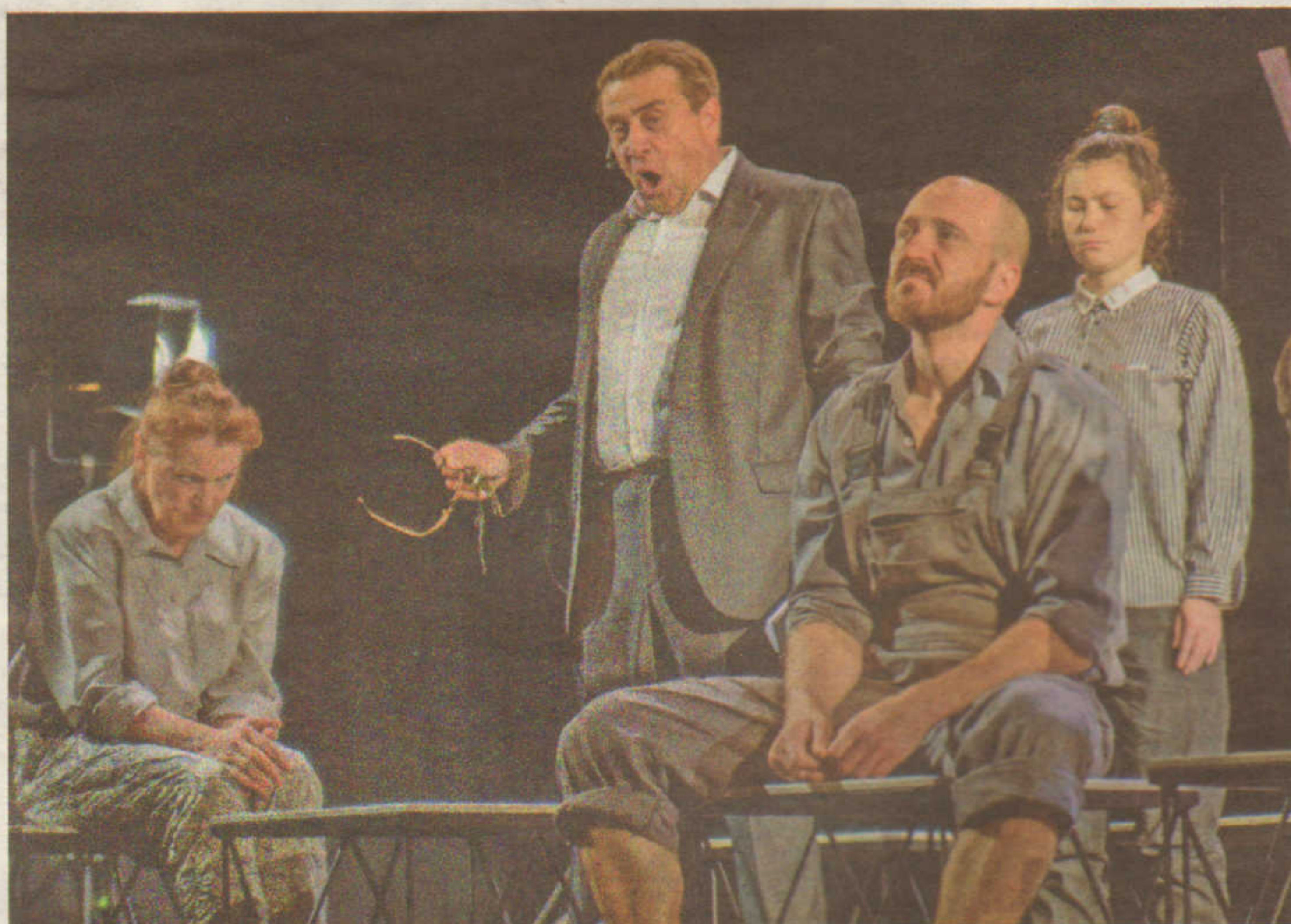
Premiera va avea loc vineri, 14 octombrie